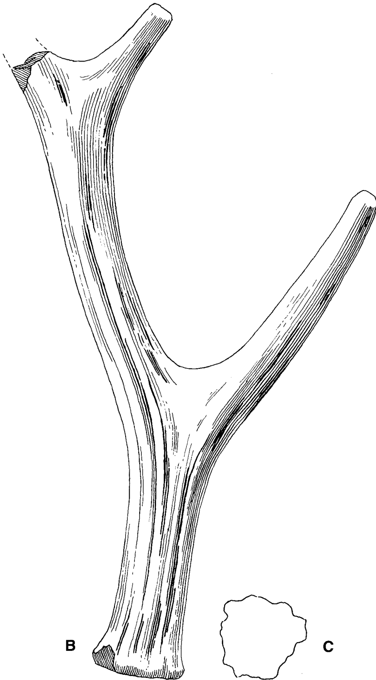
C) erhaltener Querschnitt der Rose.- Oberpannon, Mönchhof, Burgenland.- 0,7 natürl. Größe.-