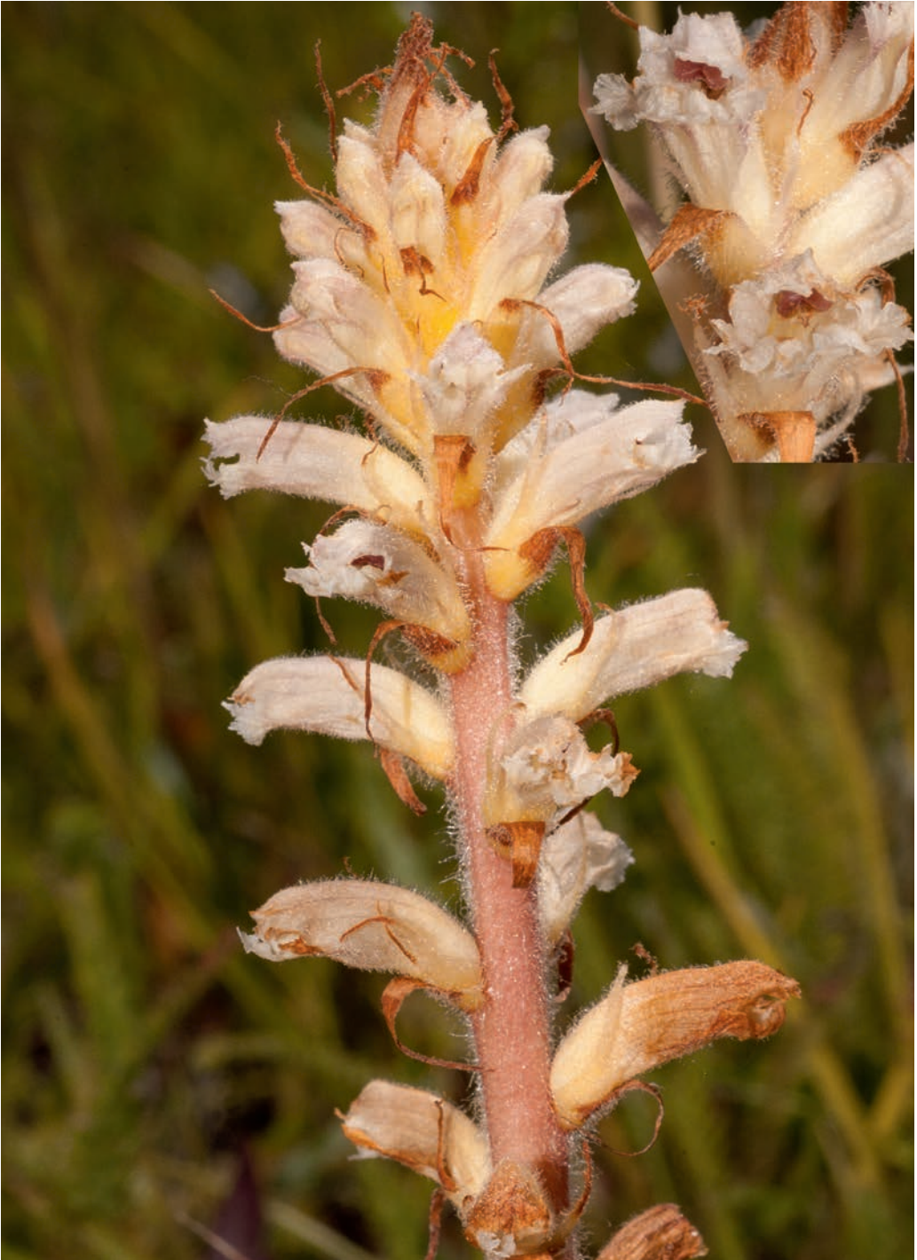
Fig. 1: Orobanche picridis F.W. SCHULTZ aus Haslach im Weinviertel (Niederösterreich), © B. Wallnöfer.