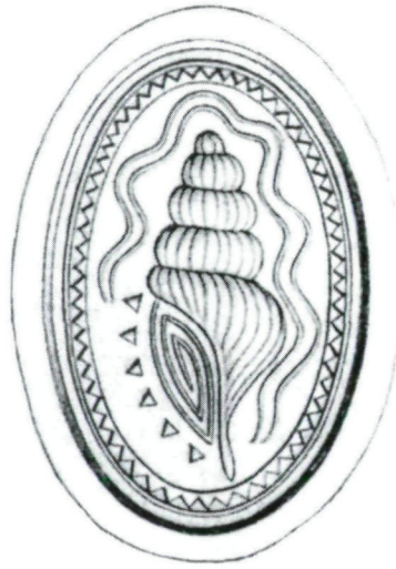
Abb. 1: Ein Siegelabdruck aus Phaistos mit einer Tritonshorn-Schale als Motiv.