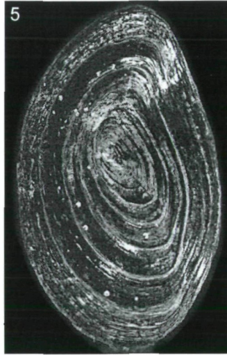
Abb. 4: Siegelabdruck aus Phaistos, der die Mündungsöffnung mit einem Operculum zeigt. (Entnommen aus: PINI, I. [1970]: Iraklion Archäologisches Museum. Die Siegelabdrücke von Phaistos, Corpus der minoischen und mykenischen Siegel. Bd. II Teil 5 Nr. 304).